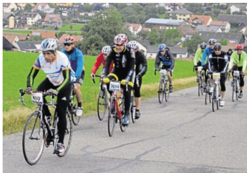
Heuer erstmals im August strampeln Hunderte von Radfahrern auf den verschiedenen Strecken der Pirk Zoigltour.

➔ Anmeldung und Information: www.vcc-pirk.de